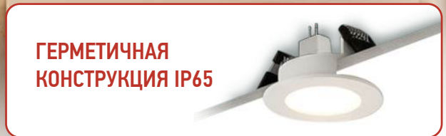
ГЕРМЕТИЧНАЯ КОНСТРУКЦИЯ IP65

Корпус светильника из высококачественного термостойкого поликарбоната, не подвержен изменению цвета или деформации корпуса. Матовый полимерный рассеиватель с антибликовым эффектом герметично соединен с корпусом, что обеспечивает защиту от влаги и пара IP65, и, соответственно, долгую службу и надежность эксплуатации. Светильник поставляется с керамическим патроном GU5.3.