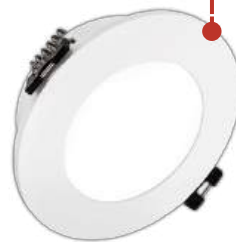
MR16R-IP65 FDP белый