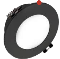
MR16R-IP65 FDP черный